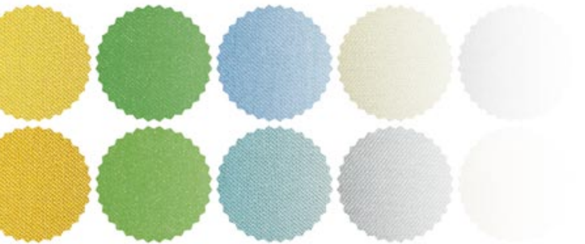
TABELLA COME LEGGERLA

Prezzi In tabella i prezzi a confezione, ma abbiamo anche calcolato il costo annuo per 5 lavaggi a settimana: sono in media 65 euro l'anno. Non poco.