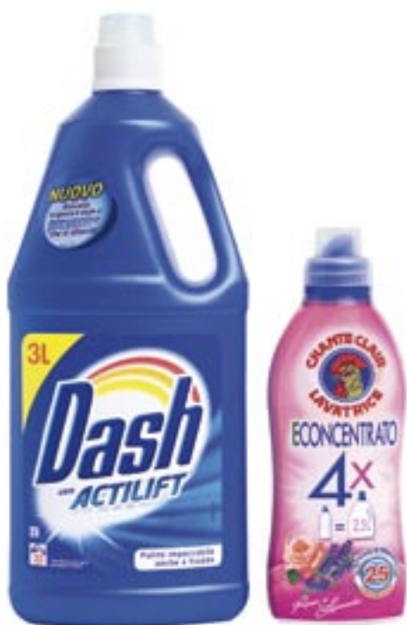
Grande differenza di imballaggio tra una confezione concentrata rispetto a una tradizionale: ma entrambe sono da 25 dosi.